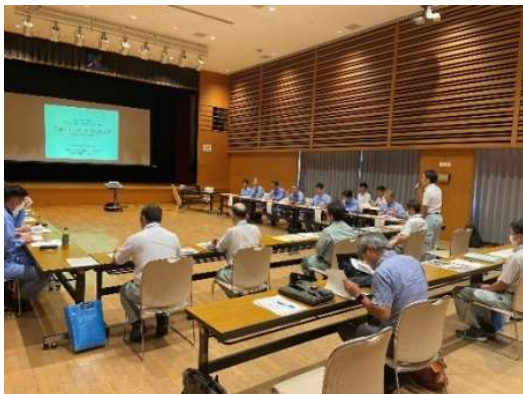
写真 1. 協議会 WG 実施状況

本事業では、アユの生息状況に関する調査を実施した。併せて、各関係者の調査結果から得られた知見を活用し、流域一体での河川環境改善に向けた具体的な取組方針を策定した。